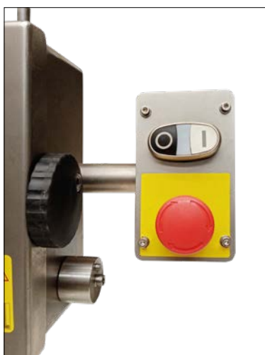
micro interrupteur de sécurité de la porte lame