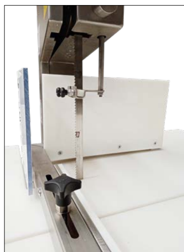
guide-lame de protection réglable